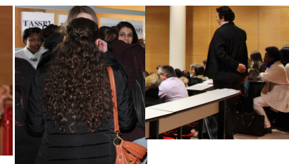
Les SPVL accueillent les participants.

Lundi 18 janvier 2016 de 9h à 12h et 13h30 à 17h30