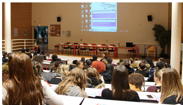
Les classes de la filière « sanitaire et social » du lycée (ASSP, SPVL, ST2S, IFAS/IFAP) ont été accueillies dans l'amphithéâtre pendant ces deux jours.