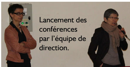
Lancement des conférences par l'équipe de direction.