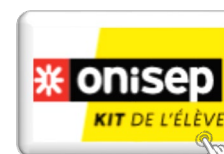
Kit ONISEP de l'élève