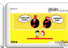
Mon printemps personnalisé