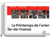
Le printemps de l'orien Île-de-France